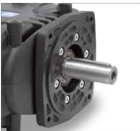
Mit Flansch zur Direktmontage eines Hydraulikmotors