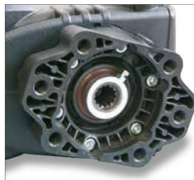
Mit Hohlwelle für Hydraulikmotor SAE B