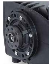
Mit zweitem Wellen- stumpf als Antrieb